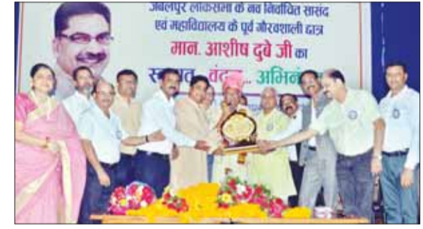
पूरा करना, आप सभी का साथ, मार्गदर्शन, सहयोग चाहिए, जो भी कमी है उसे पूरा करने का प्रयास करूँगा, पद आज है कल नहीं रहेगा परंतु सम्बन्ध हमेशा रहेगा सम्बन्ध